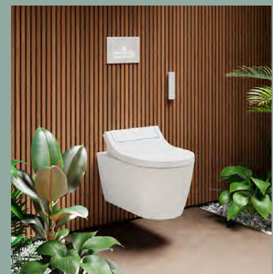
SensoWash® Classic DESIGN BY PHILIPPE STARCK