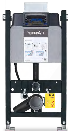
WC-Element Standard 99 cm # WD1018 000 000