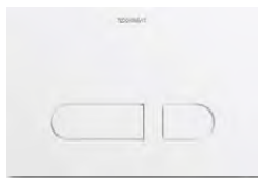
DuraSystem® Betätigungsplatte A1 Kunststoff Weiß

DuraSystem® Installationselemente bieten zuverlässige Unterputzlösungen fürs WC. Bei allen gängigen Einbausituationen ist ein schneller, sicherer und wirtschaftlicher Einbau gewährleistet. Die hochwertigen Betätigungsplatten machen die Technologie sicht- und erlebbar. Erhältlich für WCs mit mechanischer und elektronischer Spülauslösung, fügen sie sich dank ihrer klaren, zeitlos modernen Optik harmonisch in jedes Bad-Design ein.