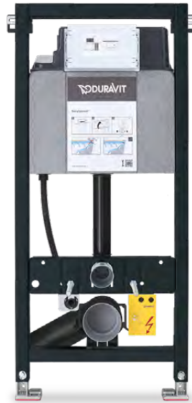
WC-Element Standard 115 cm # WD1011 000 000