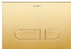
DuraSystem® Betätigungsplatte A1 Kunststoff Gold poliert