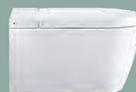
SensoWash® Starck f Pro #650002 01200 4300