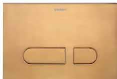
DuraSystem® Betätigungsplatte A1 Kunststoff Bronze gebürstet