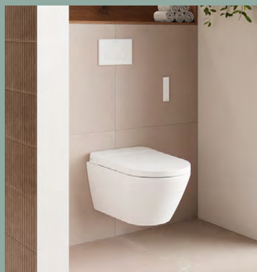
SensoWash® D-Neo DESIGN BY DURAVIT