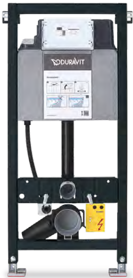
WC-Element Premium 115 cm mit integrierter Hygienespülung # WD1013 000 000