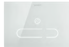
DuraSystem® Betätigungsplatte A2 mit Infrarot-Näherungselektronik ESG-Glas Weiß