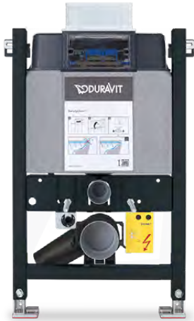
WC-Element Standard 84 cm #WD1016 000 000