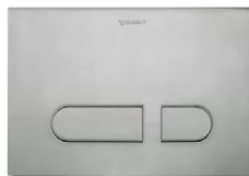
DuraSystem® Betätigungsplatte A1 Kunststoff Edelstahl gebürstet