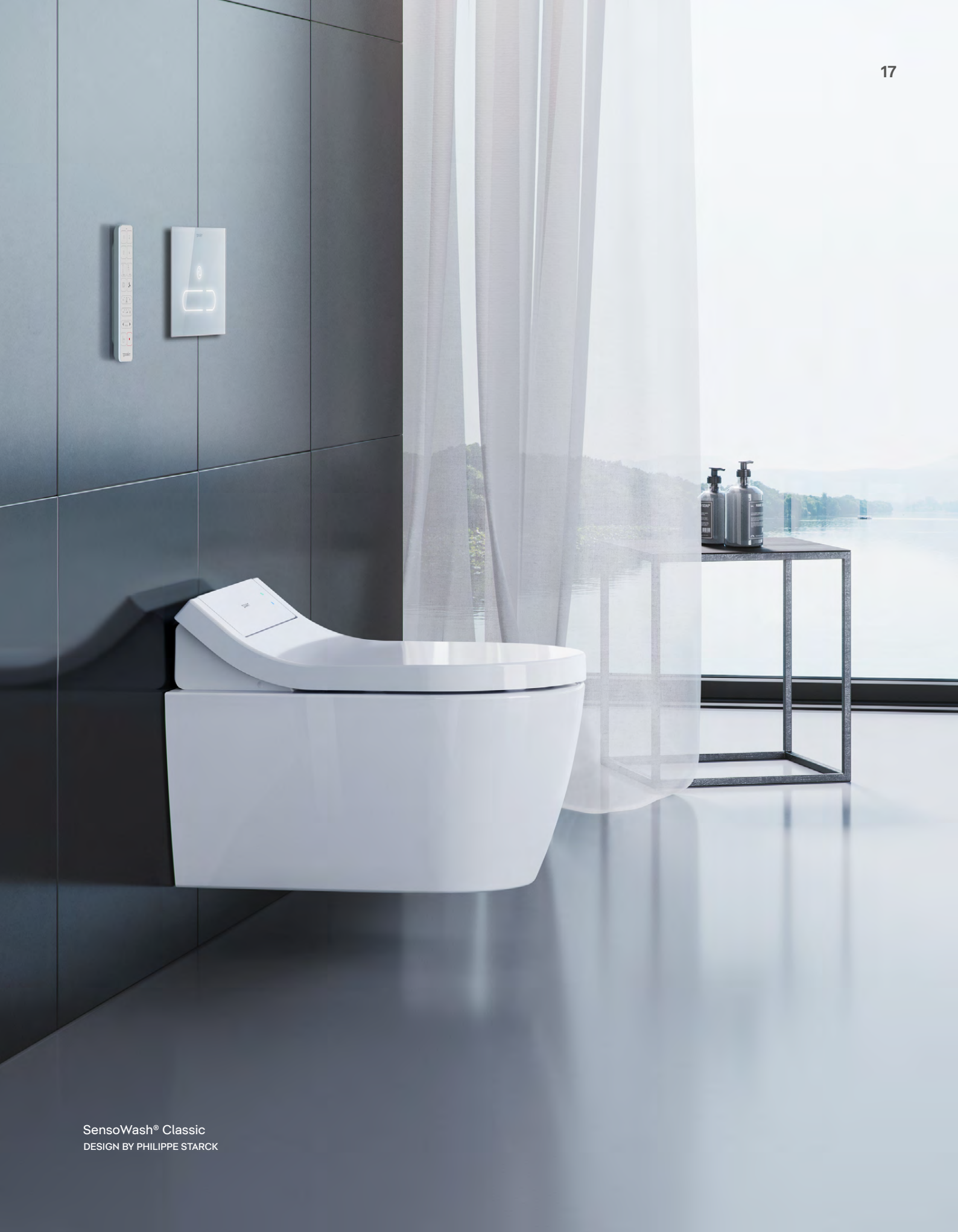
SensoWash® Classic DESIGN BY PHILIPPE STARCK