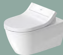
Darling New #254459