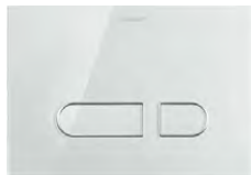
DuraSystem® Betätigungsplatte A1 ESG-Glas Weiß