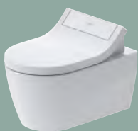
Bento Starck Box #259359

SensoWash® Classic kombiniert ein stilvolles Design mit vollumfänglichen Dusch-WC-Funktionen, die angenehme Frische und höchsten Komfort garantieren. Der Sitz fügt sich harmonisch als optische Fortsetzung der Keramik ein und wird individuell passend zu verschiedenen Duravit Design-Serien angeboten. Das dezente, aber dennoch markante Äußere gewinnt durch die edle Abdeckung in Glasoptik an Eleganz, während beleuchtete Touch-Buttons eine intuitive und benutzerfreundliche Bedienung ermöglichen.