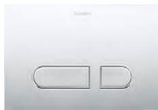
DuraSystem® Betätigungsplatte A1 Kunststoff Chrom Hochglanz