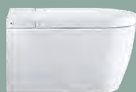
SensoWash® Starck f Lite #650001 01200 4310

SensoWash® Starck f steht für modernste reinigungsfreundliche WC-Hygiene auf höchstem technischen Niveau und in kompromisslos puristischer Optik. Alle Komponenten wurden so optimiert, dass die gesamte Technik „unsichtbar“ im Keramikkörper Platz findet. Der flache Sitz und die dahinterliegende weiße Abdeckung bilden eine stringente, harmonische Einheit, die optimal zu allen Duravit Designserien passt. SensoWash® Starck f ist in den drei Ausstattungsvarianten Pro, Plus und Lite erhältlich, abgestimmt auf die persönlichen Bedürfnisse.