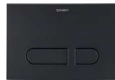
DuraSystem® Betätigungsplatte A1 Kunststoff Schwarz Matt