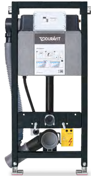
WC-Element Standard Plus 115 cm mit Geruchsabsaugung manuell # WD1012 000 000