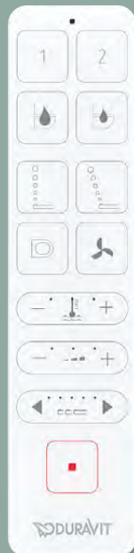
SensoWash® Starck f Lite