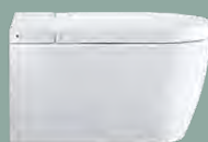
SensoWash® Starck f Plus #650000 01200 4320