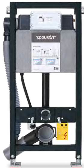
WC-Element Premium Plus 115 cm mit Hygienespülung und Geruchsabsaugung # WD1014 000 000