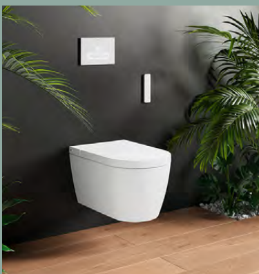
SensoWash® Starck f DESIGN BY PHILIPPE STARCK