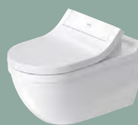
Starck 3 #222659